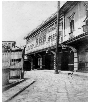
Figura 2. Barrio Las Peñas