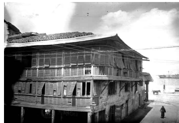
Figura 1. La Casa de las Cien Ventanas

Los principales ingresos de los guayaquileños son el comercio formal e informal, los negocios, la agricultura y la acuicultura; el comercio de la gran mayoría de la población consta de pymes y microempresas, sumándose de forma importante la economía informal que da ocupación a miles de guayaquileños.