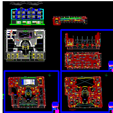
Figura 4. Diseño del Hostel

El equivalente de un barrio con historia y tradición es el Barrio