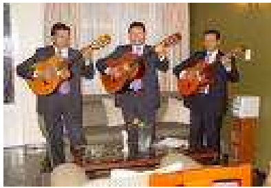
Figura 7. Las Serenatas