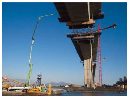
Fig 7. Bombeado de hormigón para fundición de dovelas

Con la dosificación anterior se fundieron todas las dovelas del puente, el hormigón fue bombeado a mas de 55 m de altura [15].