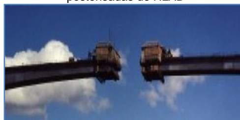
Figura 3. Construcción del tramo con HLAD

A continuación se muestran resultados de los ensayos en el hormigón del período de noviembre de 1997 a febrero de 1998.