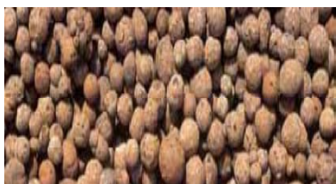
Figura 1. Arcilla expandida

La arcilla expandida es un agregado duro, redondeado de alta porosidad, de color marrón claro y con un peso específico que puede variar entre 270 y 600 kg/m 3 aproximadamente. Posee una superficie rugosa y pueden ser fabricadas en granulometrías variables entre 0 y 40 mm.