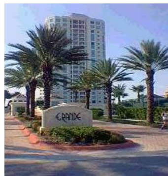
Figura 6. Vista de los condominios Sand Key Fase II

El hormigón liviano de alto desempeño es utilizado cada vez más en edificios para oficinas y residenciales para así lograr luces mayores. Los Condominios Sand Key se encuentran cerca de Tampa, Florida, USA. Las especificaciones del proyecto piden resistencias a compresión a los 28 días de 62 MPa con un peso unitario de 1760 kg/m 3 para las losas. Todo el hormigón liviano de alto desempeño fue colocado mediante bombeo con un