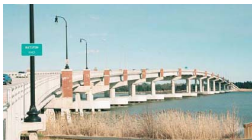
Figura 4. Ruta 33, puente sobre el río Mattaponi.

En la Ruta 33 sobre el río Mattaponi se construyó un puente, con una longitud total de 1052 m. Para este puente, la resistencia especificada para las vigas de hormigón fue de 56 MPa con una densidad de 2000 kg/m 3 , 24 GPa de módulo de elasticidad y un contenido de air de 4,5 ± 1,5% [12].