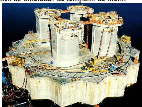
Figura 5. Base estructural de la plataforma Hibernia parcialmente sumergida

El proyecto tenía que cumplir una apretada programación de las obras lidiando con condiciones extremas de temperatura. La base estructural de la plataforma tenía que soportar el hielo y deshielo, la abrasión, la acción del viento y las olas, y al ataque químico. Además, la gigantesca estructura estaba obligada a flotar, ser remolcado al sitio, y después de ser colocado, debía resistir el impacto de 5,5 millones de toneladas de témpano de hielo.