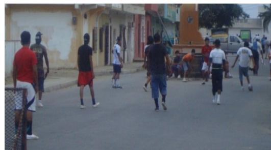
Foto 1. Grupo de jóvenes jugando futbol

El análisis reflejó que el 33% de los salinenses dedica tu tiempo libre al deporte, entre los que sobresalen esta el futbol y el voleibol.