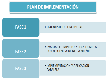
Figura 1. Plan de Implementación