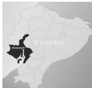
Figura 1. Ubicación de Puerto de Guayaquil

Es el único puerto del país que puede convertirse en el más eficiente del país, con menor inversión Excelente abrigo de la acción de corrientes, oleajes y vientos de mar abierto. Profundidad suficiente para el manejo de la carga. Con el dragado actual a mediano y largo plazo. Suficiente disponibilidad de espacios para la construcción de nuevos muelles y facilidades (Áreas de reserva Baja sensibilidad del manejo portuario respecto a fluctuaciones de la economía nacional. ). Especialización en tráfico y carga. Solvente situación financiera Ausencia de sindicatos. Prestación adecuada de servicios portuarios por la empresa privada. Baja interferencia en general con áreas urbanas Cercanía con el centro industrial más importante del país. Cercanía con una ciudad que empieza a funcionar como marca turística. Certificación en el Código Internacional de Seguridad para Buques e Instalaciones Portuarias PBIP - ISPS.