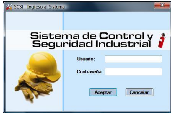
Figura 1. Pantalla Inicial de la Aplicación Informática

El objetivo de la aplicación informática es complementar y facilitar la administración y el control del Sistema.