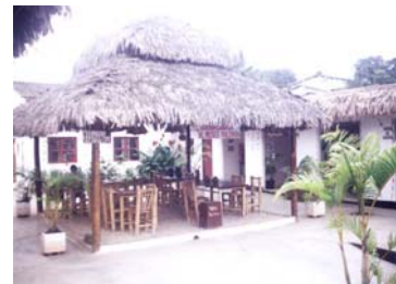
Figura 4. Museo de Valdivia

El Museo de Valdivia cuenta con piezas pertenecientes a la cultura Chorrera (4200 a 500 a.C.) y Valdivia (4200 a 1500 a.C.) además de maquetas y réplicas que nos informan de la forma de vida de las civilizaciones que habitaban esta región. El costo es para adulto nacional $ 0.80, extranjero $ 1.00 y niños $ 0.30, el horario es de 09H00 a 17H00 todos los días (ver figura 4).