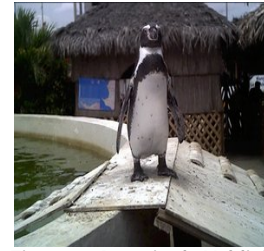
Figura 3. Acuario de Valdivia

2.1.1 Valdivia. Ubicada en el Km. 42, en la carretera principal de la Vía del Pacífico en la provincia Santa Elena, esta playa cuenta con dos atracciones turísticas, el Acuario y el Museo. El Acuario cuenta con cabañas donde se encuentran diferentes especies acuáticas como peces, crustáceos, anfibios y moluscos, así como aves vivas y restos de esqueletos de otras [1]. El costo de entrada en el Acuario es de $ 1.00 adultos, $ 0.50 niños hasta 15 años y estudiantes, el horario de atención es todos los días de 08H00 a 18H00 (ver figura 3).