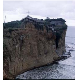
Figura 9. Santuario de Olón

2.1.8 Olón. Ubicado al norte de Montañita, cada 11 de noviembre, día del aniversario del milagro en que la virgen lloró, cientos de peregrinos acuden a esta iglesia a rendirle honores a la venerada imagen. El santuario fue construido en el año de 1984 en la cima de un peñasco de aproximadamente 100 metros de altura sobre el nivel del mar, donde se puede admirar uno de los más hermosos escenarios costeros, factores que juntos, crean un ambiente de gran espiritualidad (Ver figura 9).