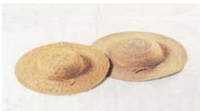
Figura 6. Artesanía en fibras de Toquilla, Sapan y Cabuya

2.1.4 Manglaralto. Pueblo de gran importancia en el desarrollo de las comunidades de la zona. Aquí se encuentra la Fundación Propueblo que se encarga de comercializar las artesanías elaboradas a base de sapán (fibra de plátano), paja toquilla, marfil vegetal o tagua, entre otras [2] (Ver figura 6).