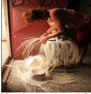
Figura 5. Elaboración de sombreros de Paja Toquilla

2.1.3 Sinchal, Barcelona, San Antonio y Cadeate Pequeñas comunas de hábiles artesanos donde se elaboran joyas de plata, diferentes objetos de paja toquilla además de artesanías a base de madera.