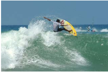
Figura 7. Surf en Montañita

conviven en un ambiente relajado pero lleno de diversión y deporte.