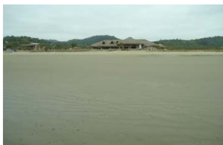
Figura 11. Playa de San José

Rodeado de bosques de transición (Seco – Húmedo Tropical) con gran cantidad de Fauna y Flora propias, San José está situado en el mismo centro de todas las poblaciones Costeras desde donde se puede observar Ballenas Jorobadas durante los meses de Junio y Septiembre, o realizar otras actividades de Ecoturismo como observación de aves, visita a Centros Arqueológicos de la zona, acceso a centros Artesanales, caminatas en el bosque, Camping, Buceo, Pesca, Surf, o visitar la Isla de “La Plata” (Reducto de vida Marina similar a la de las Islas Galápagos, dentro del Parque Nacional Machalilla).