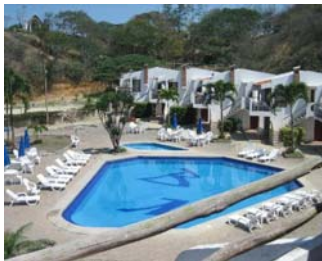
Figura 8. Hotel Baja Montañita

Con el tiempo, Montañita comenzó a levantarse con casas de veraneo, pequeños hoteles y restaurantes rústicos, creado por guayaquileños y algunos extranjeros que se enamoraron de este lugar y quisieron establecerse ahí. Entre los mejores hoteles se encuentra el Baja Montañita ubicado frente al mar, el cual cuenta con 18 habitaciones, 15 cabañas y 2 suites además de una sala de conferencias (ver figura 8). El Ecolodge Cabañas Nativa Bambú entra en esta categoría con 8 cabañas y 3 suites que garantizan una estancia de primera, estos dos hoteles cuentan con los servicios básicos además de restaurantes y servicio de TV Cable. La Casa del Sol cuenta con 10 habitaciones y es más económica, al igual que la hostería Centro del Mundo cuya singularidad se basa en que además de las habitaciones, ofrece en su último piso alrededor de 20 camas con cajones de madera para guardar las pertenencias de los turistas por $5 la noche.