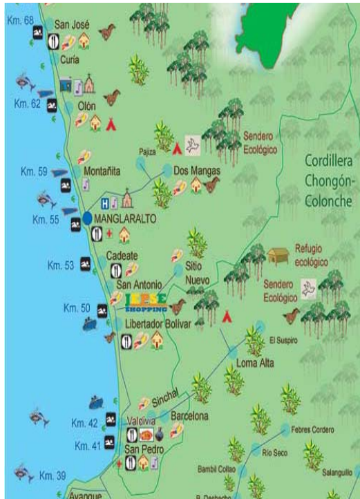
Figura 2. Mapa Ruta Valdivia-San José