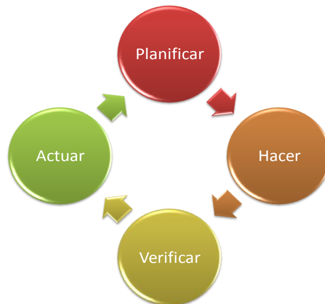
Figura 1.2 CICLO DE MEJORA CONTINUA

Las Normas de los Sistemas de Gestión basan en el Ciclo PHVA (ver figura 1.2) su esquema de la Mejora Continua del Sistema de Gestión de la Calidad.