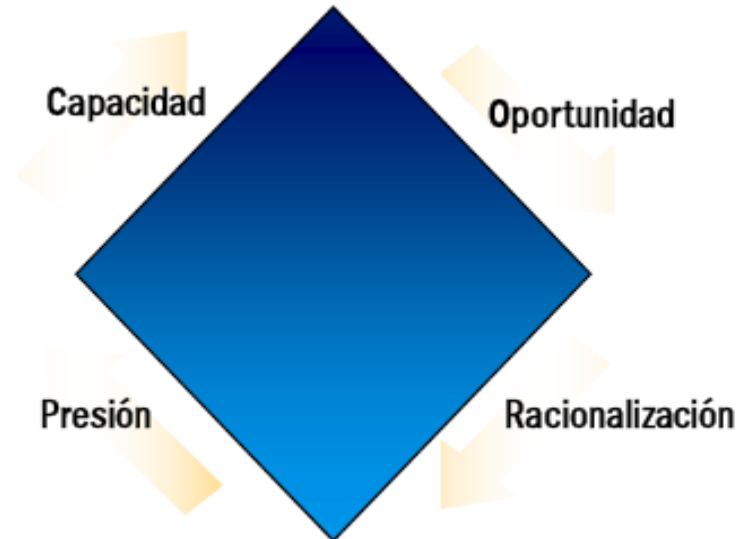
Gráfico 1: Diamante del Fraude