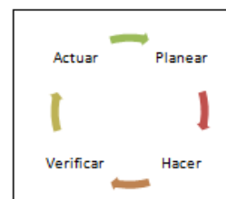
Figura 1.2 Ciclo de Mejora Continua

El ciclo de mejora continua se basa en la metodología conocida como PHVA y puede ser aplicada a todos los procesos de sistema de gestión de seguridad y salud ocupacional. Las siglas PHVA significan: Planear, Hacer, Verificar y Actuar. [4]