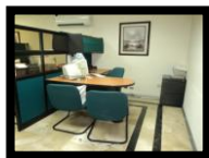
Figura 4.3 Puesto de trabajo

El puesto de trabajo ideal para poder desempeñar las labores debería cumplir con las siguientes características.