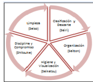
Figura 1.2 Cinco's

Se aplica las 5S's para mejorar los niveles de calidad, eliminación, reducción de resultados que requiere el compromiso personal para que la empresa sea un modelo de organización, limpieza, seguridad e higiene.