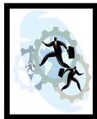
Figura 4.2 Prohibiciones