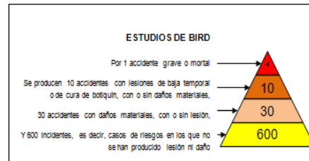
Figura 1.1 Estudios de Bird

Este análisis relaciona que por cada accidentes que se producía originando lesión o incapacidad, había 30 accidentes con lesiones materiales con o sin lesión, que solo precisaban de 10 accidentes por lesión o cura con o sin daños materiales y 1 accidente por daño a la propiedad. [2]