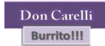
Figura 1: Logotipo del producto

El nombre comercial que hemos adquirido es de “Don Carelli”, acompañado por el producto que estamos comercializando en este caso la palabra “Burrito!!!” el mismo que tiene signos de admiración, pues se pretende expresarlo como una gran exclamación.