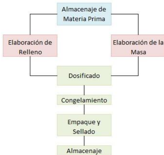
Figura 3: Flujo de Elaboración del Burrito Congelado

A continuación se muestra el diagrama de flujo para la elaboración del Burrito Congelado.