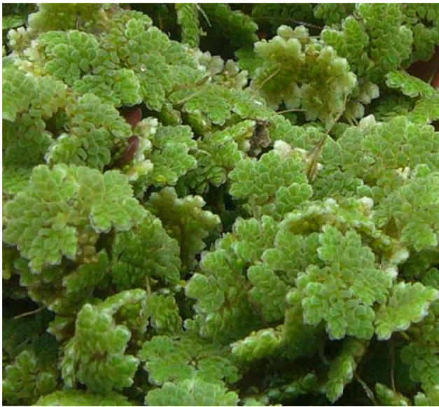
Figura 1. Azolla : nuevo paradigma

Azolla (Figura 1) es un diminuto helecho acuático flotante que alberga en sus hojas a la cianobacteria Anabaena (Figura 2). El simbiote Azolla-Anabaena fue considerado como un potencial abono verde para el arroz (Figura 3) y demás cultivos del Ecuador, como banano (Figura 4). Por esta razón, en el Instituto de Ciencias Químicas y Ambientales (ICQA) de la ESPOL (Escuela Superior Politécnica del Litoral) ha trabajado desde hace trece años en esta investigación.