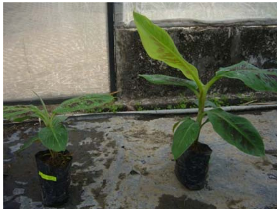
Figura 3. Banano. Diferenciado crecimiento con Azolla

Este desarrollo ha contado con patrocinio del BANCO MUNDIAL, sumado a los esfuerzos de la ESPOL, PROMSA (Programa de Modernización de los Servicios Agropecuarios) y SENESCYT (Secretaría Nacional de Educación Superior, Ciencia y Tecnología).