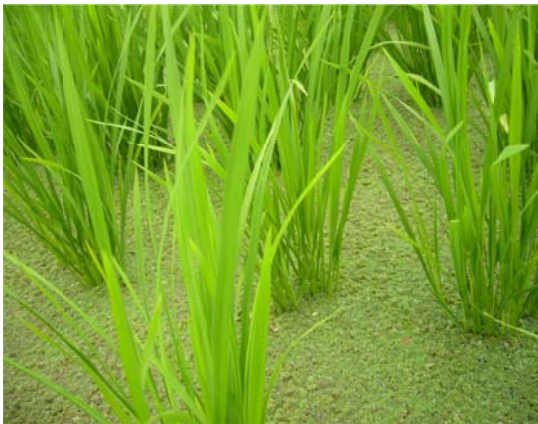
Figura 3. Azolla abonando el arroz