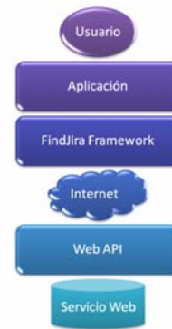
Figura 1. Ubicación del framework entre el usuario y el internet.

Desde el usuario objetivo que se encuentra al final de la cadena, es decir la persona que necesita información y realizará las búsquedas a través de una interfaz que utilice FindJira framework, hasta el internet que es la fuente de toda información en línea, los datos viajan a través de varias etapas a las que se denominan capas, estas capas se comunican entre sí y a su nivel, el mismo que cada vez es más bajo. FindJira framework actuará en la mitad del camino, como puente entre el desarrollador y hacia la comunicación con los APIs de los servicios web que indexan contenidos de internet.