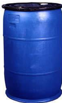
Figura # 4. Tanque de abastecimiento

El sistema de distribución de agua contará con una tanque de abastecimiento (TA) de 300 litros (Figura # 4), el mismo tendrá en su interior una bomba sumergible de 1,5 HP para el transporte del agua al tanque de decantación (TD) (Figura # 5). La gran mayoría del sedimento se irá al fondo del tanque, otorgando un agua parcialmente libre de sedimentos a las tanques de producción.