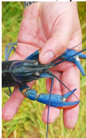
Figura # 1. Langosta Australiana ( C. quadricarinatus )

(1) (2), y se perfila como un candidato con buen potencial para desarrollarse como especie ornamental (3).