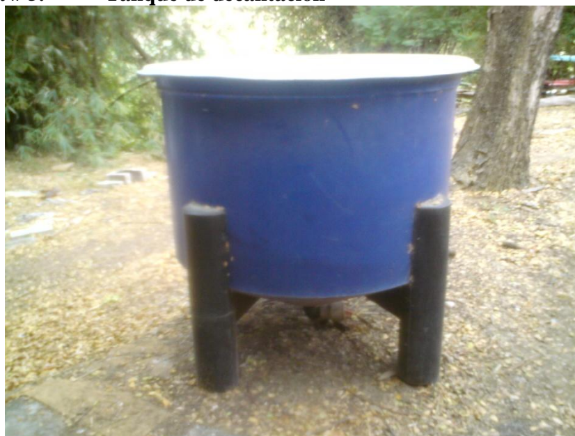
Figura # 5. Tanque de decantación