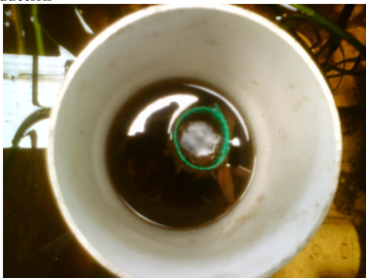
Figura # 6. Vista Superior del Sistema de desagüe de tanques de reproducción

cm (11) El agua de salida de las tanques se dirigirá mediante una tubería al TA, repitiéndose el proceso.