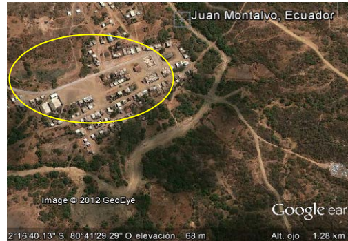
Imagen 4.- Micro localización

El Área del terreno es de 180 metros cuadrados y estará ubicado cerca de la casa comunal. El sistema de transporte que se utiliza es Inter-Provincial.