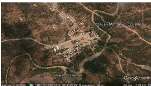
Imagen3.- Macro localización

La comuna se encuentra ubicado desde el Kilómetro 112 de la vía Guayaquil - Salinas a una distancia aproximadamente 3Km hasta llegar al pueblo. El área del terreno de Juan Montalvo es 3 k m 2 .