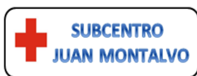
Imagen 1.- Logo del Subcentro

Ser uno de los subcentros médicos más reconocidos en toda la provincia por su eficiencia, rapidez y calidad, contando con el equipo médico adecuado para disminuir los problemas de salud de la población.