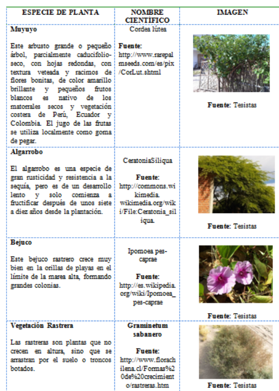
Figura 2: Vegetación del Recinto El Arenal

Se pudo observar que la forma de la playa es recta y abierta, esto se debe a que no existen entrantes ni salientes de mar en toda su extensión, su arena es de un color café claro y de textura fina, el agua tiene un aspecto ligeramente turbio y sus olas son apacibles.