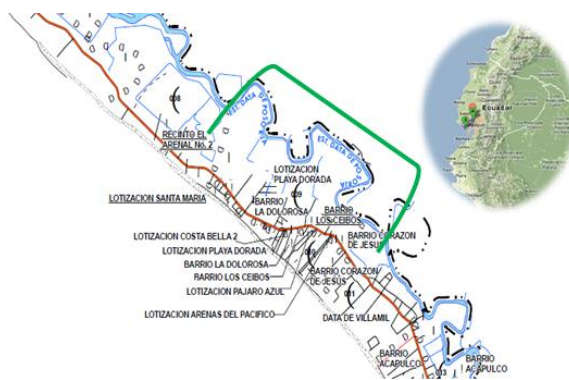
Figura 1: Ubicación de La Playa El Arenal