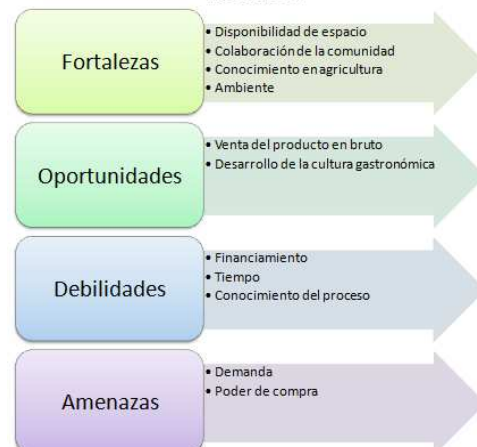
Figura 2: FODA