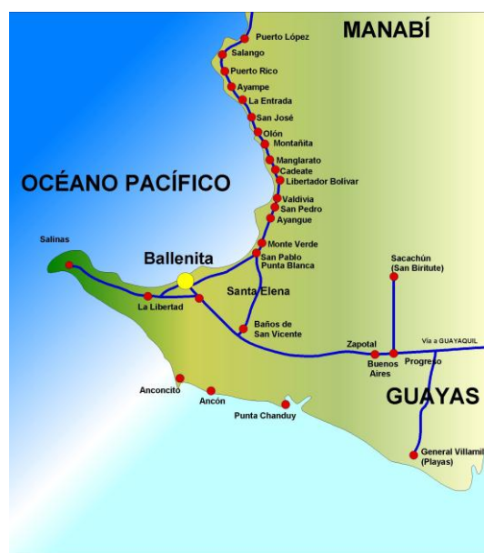
Figura 1. Ubicación de Ballenita en la Península de Santa Elena

2.1.2. Mapa. A continuación se encuentra un mapa en el cual se puede observar la ubicación del balneario Ballenita en relación a la Península de Santa Elena.