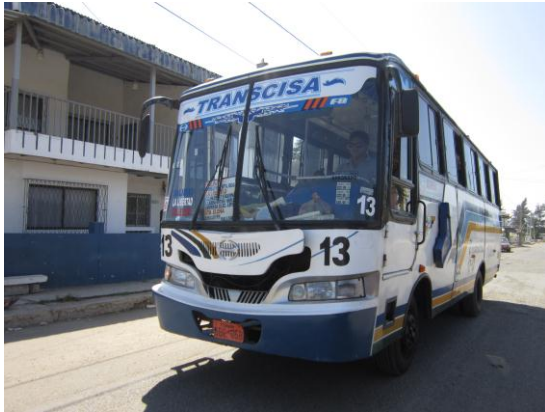
Foto 1. Cooperativa Transcisa

Desde la ciudad de Guayaquil (Terminal Terrestre Jaime Roldós Aguilera) hacia los diferentes cantones de la Provincia de Santa Elena se cuenta con los siguientes medios de transporte: Cooperativa Libertador Peninsular, Cooperativa Interprovincial Costa Azul, y LIBERPERSA.