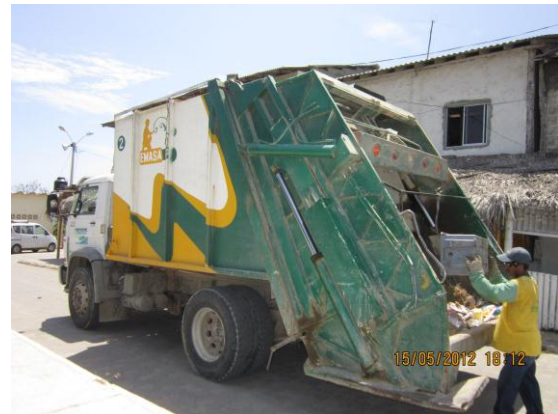
Foto 2. Carro recolector de desechos sólidos

Los servicios médicos no son los adecuados, existe un punto de salud administrado por funcionarios del Ministerio de Salud Pública, el cual lamentablemente no cuentan con instalaciones propias y funciona en un espacio reducido, las personas que requieren de asistencia médica por lo general se movilizan al Hospital Liborio Panchana ubicado en la cabecera cantonal de Santa Elena