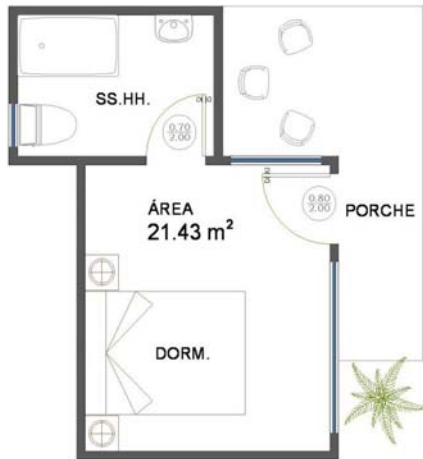
Figura 7. Plano Cabaña Simple “La Campiña Resort Club”

Cabañas: El resort contará con 10 cabañas divididas de la siguiente manera. 5 serán habitaciones matrimoniales (capacidad para 2 personas), las cuales tendrán en su interior su respectivo baño como también un porche en la entrada lo que permitirá el contacto con la naturaleza y demás instalaciones del resort club. El área de éstas a será 21.43 m 2 . Las 5 cabañas restantes con capacidad para 4 personas tendrán un área de 35.47 m 2 lo que incluye dos dormitorios, un baño, sala de estar y porche en su exterior.