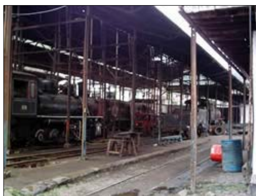
Figura 1. Ferrocarril ruta Yaguachi-Bucay

Fue el 31 de octubre de 1887 cuando el presidente de la República Don Plácido Caamaño, decretó que se elevara a la categoría de parroquia al sitio denominado El Carmen que pertenecía al cantón Yaguachi; su Ilustre Concejo Municipal decreta los siguientes límites: Norte: Cresta de la montaña por cuyas faldas corre el río Chimbo; Sur: el Río Blanco desde su origen y el río Chimbo hasta Agua Clara; Este: El meridiano 79 que pasa por el río Blanco y Oeste: Cascada de Agua Clara.