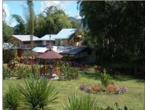
Figura 5. Modelo Resort

La construcción de la misma estará dada en una estructura de cemento y partes decorativas en caña guadua y madera.