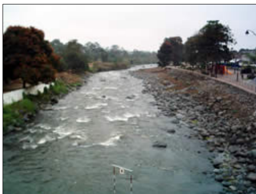
Figura 3. Río Chanchan

Por encontrarse en la falda de la Cordillera esta bañado por un sinnúmero de ríos entre ellos. San Antonio, Limón, Chagüe Grande, Chagüe Chico, Agua Clara, Alvarado, Mallahuan, Blanco, Chanchán y su río más grande: el Chimbo.