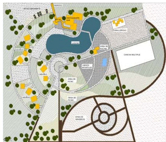
Figura 6. Plano “La Campiña Resort Club”

El proyecto se entregará con portón de ingreso para el Hotel.