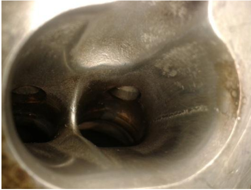
Figura 4-9: Pulido de los Conductos de Admisión.

3.4.3. Header. El escape que se va a montar en el motor va a brindar una mejor refrigeración de la recámara de combustión ya que los gases de escape van a salir a mayor velocidad provocando que la succión de dicha acción absorba la mezcla de aire-combustible bajando la temperatura se trata de un sistema 4-2-1 lo que quiere decir que del cabezote salen los cuatro tubos de escape y luego se unen en dos para luego volver a unirse en un solo tubo de escape, obviamente los tubos tienen una longitud que se ha calculado en base a 3 fórmulas para averiguar la relación de los diámetros de los tubos primarios y secundario, además de el cálculo de la longitud de cada los tubos primarios y secundarios. Se toma en cuenta que los tubos primarios son aquellos que salen del cabezote hasta la primer conexión de ese punto en adelante se llama tubo secundario.