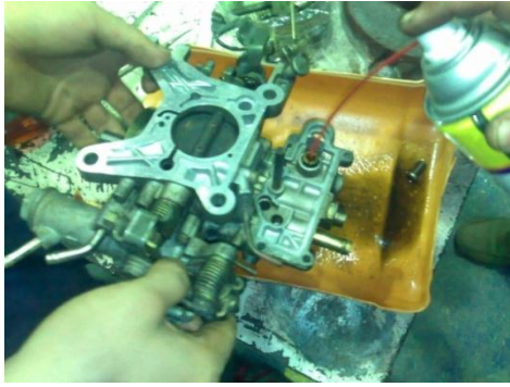
Figura 1-10: Limpieza del carburador.