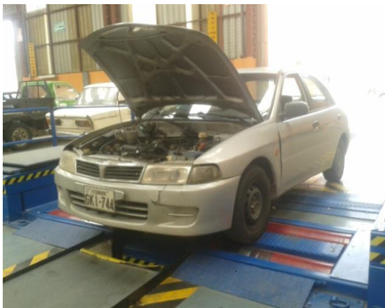
Figura 12. Prueba en el dinamómetro

Durante el transcurso del trabajo se procede a poner énfasis en seguir los procedimientos técnicos dados por el fabricante del motor.