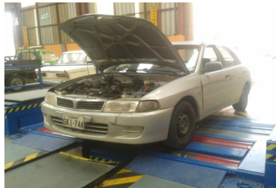
Figura 1-14: Prueba en el dinamómetro.

En esta fase se realiza las pruebas para verificar el aumento de potencia.