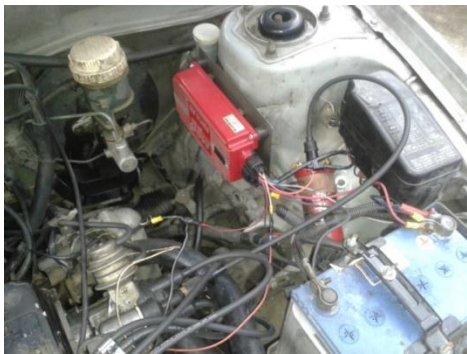
Figura 1-11: Msd 6al montada en el habitáculo del motor.