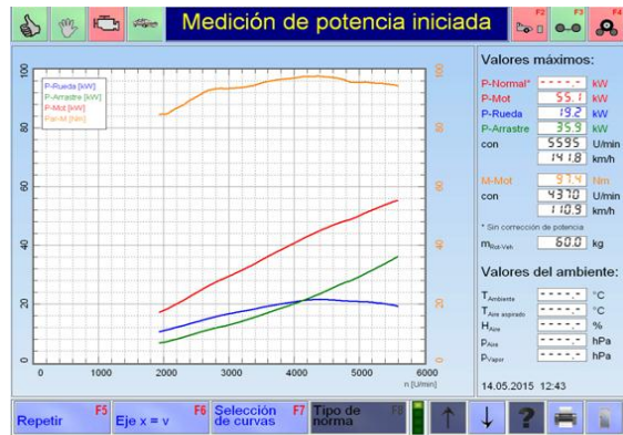
Figura 5-1: Medición de potencia.

Se comprueba que se obtiene un aumento de 10.36% de potencia con respecto a la potencia nominal.