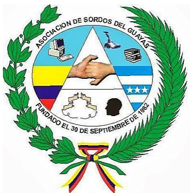
Figura 1. Escudo de la Asociación de Sordos del Guayas