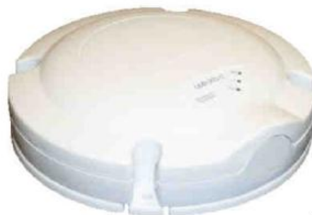
Figura 2. DMR 200 [2]

Dispone de un sistema de posicionamiento geográfico GPS e integra en sí mismo un dispositivo de comunicación que le permite intercambiar información tanto en transmisión como recepción a través de una antena omnidireccional, ver figura 2.