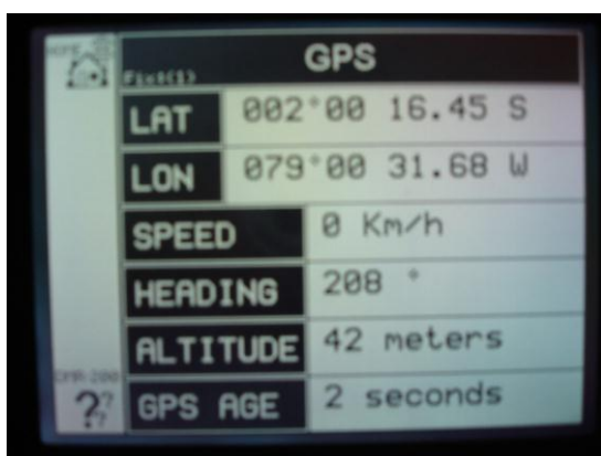
Figura 1. Estado de GPS MDT1500

El sistema consiste de una estación de control, y de 10 estaciones móviles. La estación de control está conformada por un computador personal con conexión a Internet, el usuario de la estación de control debe entrar al sistema con nombre de usuario y una contraseña e inmediatamente se muestran las aplicaciones del Geotracker con nuestras unidades móviles. En cada una de las unidades móviles se encuentra un DMR200 y un MDT1500 interconectados, las unidades remotas pueden enviar y recibir mensajes de texto usando el MDT1500 como editor de texto y de mensajes de auxilio, también de ver su posición (latitud, longitud, altura y hora) por medio de su GPS, ver figura 1.