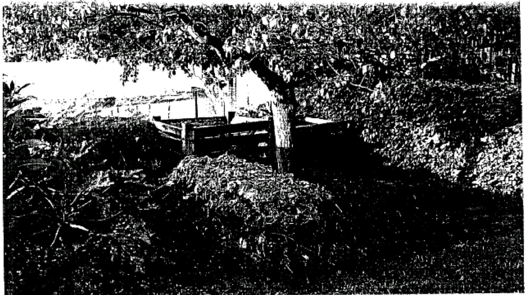
Un lugar óptimo de compostaje con montones apilados en capas limpias, silos de madera y un carrizo bien asentado de baldosas.