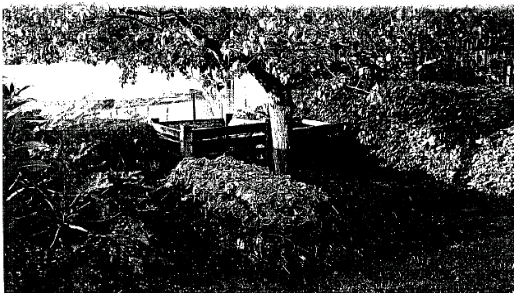
Un lugar óptimo de compostaje con montones apilados en capas limpias, silos de madera y un camino bien asentado de baldosas.