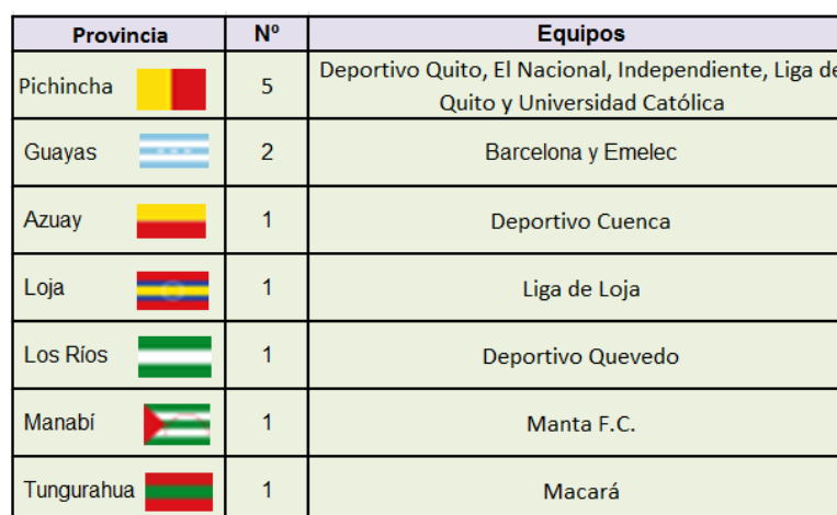
Figura 3.5: Equipos por provincia año 2013

En la figura 3.4 se muestran todos los equipos que participarán en el campeonato Ecuatoriano del presente año. Así mismo se puede clasificar a los equipos por provincia y esto se muestra en la figura 3.5 que se presenta a continuación.