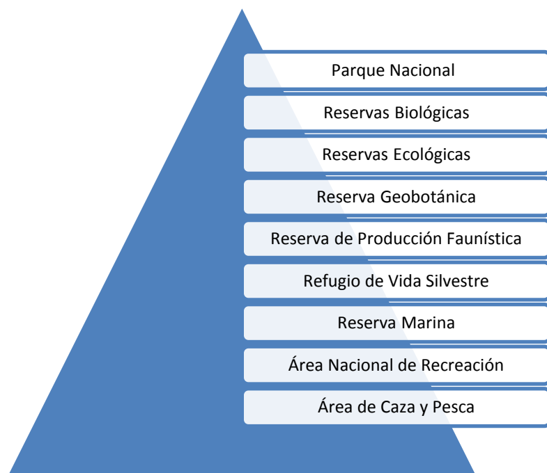
Figura 3. Categorías para la selección de Áreas Protegidas

En este Subsistema están las Áreas Naturales de interés Nacional, y es el subsistema que será analizado en este estudio. Actualmente existen 48 Áreas Protegidas que han sido seleccionadas según las siguientes categorías: