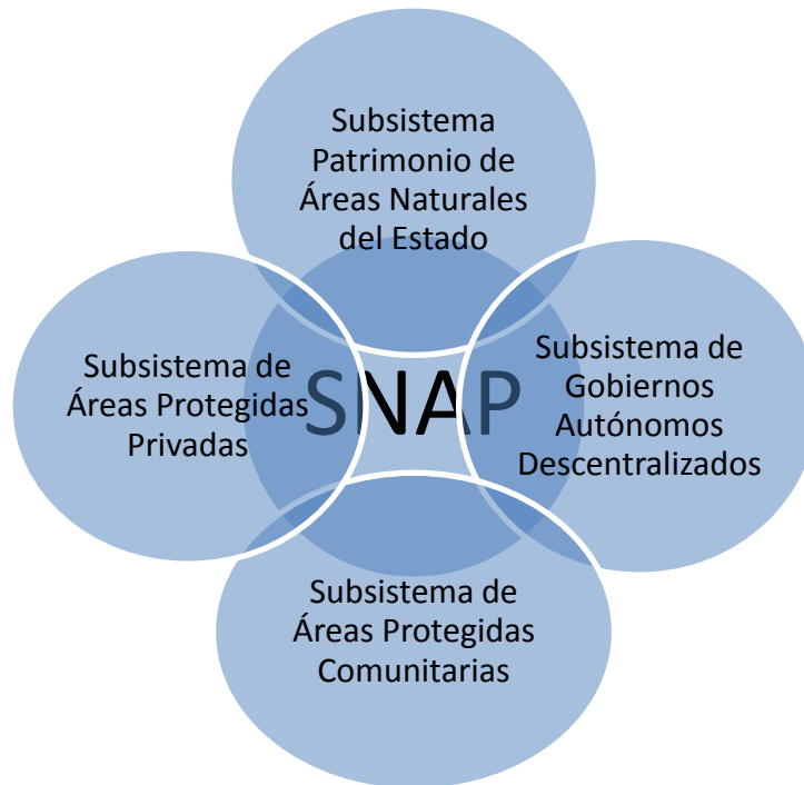
Figura 2. Subsistemas de Áreas Protegidas del Sistema Nacional de Áreas Protegidas.