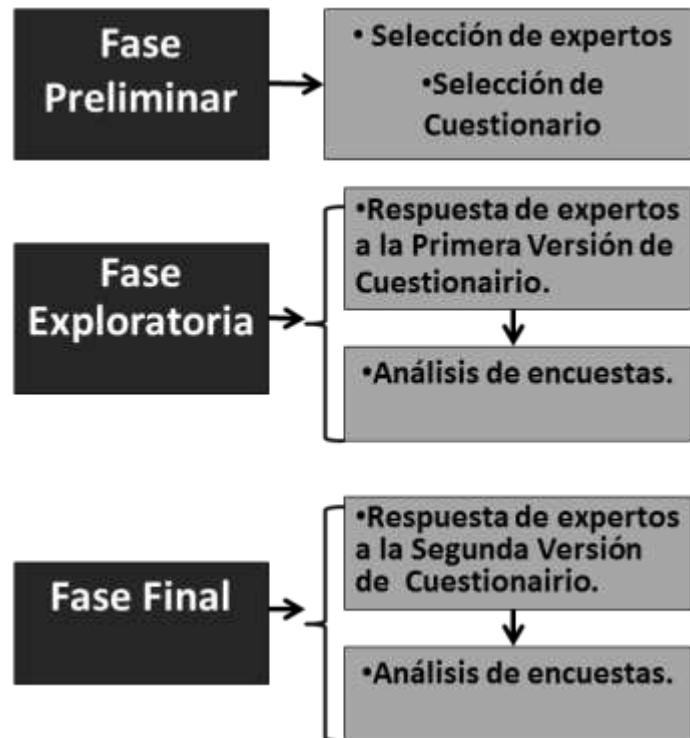
Figura 4. Metodología usada para valoración de criterios de las Áreas Protegidas