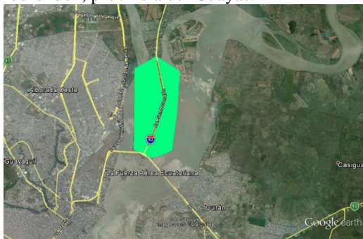
Figura 1. Cobertura de Clientes

El diseño de la red tiene como objetivo brindar servicios a clientes corporativos ubicados en el sector de La Puntilla hasta el kilómetro 5 de la vía Samborondón, provincia del Guayas.