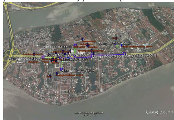
Figura 3. Tendido de la fibra y ubicación de las mangas de empalme.

El tendido de fibra de 12 hilos menor no debe superar los 350 metros debido a que a distancias mayores se presentan atenuaciones y pérdidas de potencia.