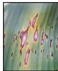
Figura 1. Sigatoka

fungicidas. La medida de control mas comúnmente usada para el control de la sigatoka es la fumigación aérea, la cual es costosa e implica poseer la infraestructura necesaria para el aterrizaje de las aeronaves.