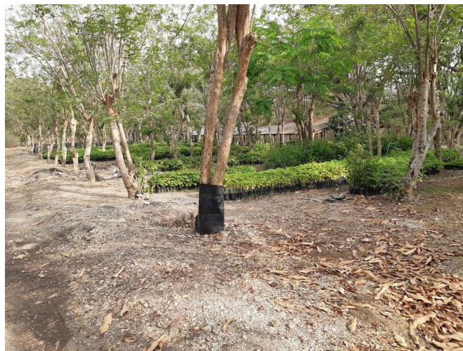
Figura 3: Foto de vivero forestal de la Fundación ProBosque

En comparación con la propuesta de Guía Estándar de Reforestación de bosque seco, las actividades de las reforestaciones implementadas en el Bosque Protector Cerro Blanco a través de la Fundación ProBosque solo tuvieron el cumplimiento de dos actividades de las ocho previstas para la fase de diagnóstico y planificación que son la selección de plantas y también la producción de plantas en vivero, lo cual denota la importancia de contar con personal técnico con experiencia para la colecta de semillas (CONAFOR, 2010) y un vivero permanente para producción de plantas que se encuentre a corta distancia de las áreas a reforestar (Ruiz, 2002), como se observa en Figura 3.