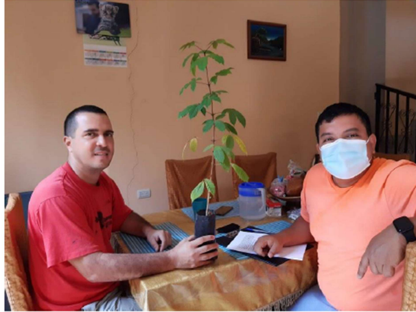
Ilustración 1.- Imagen de entrevista a experto local mostrando especie forestal de bosque seco producida en vivero de iniciativa personal.