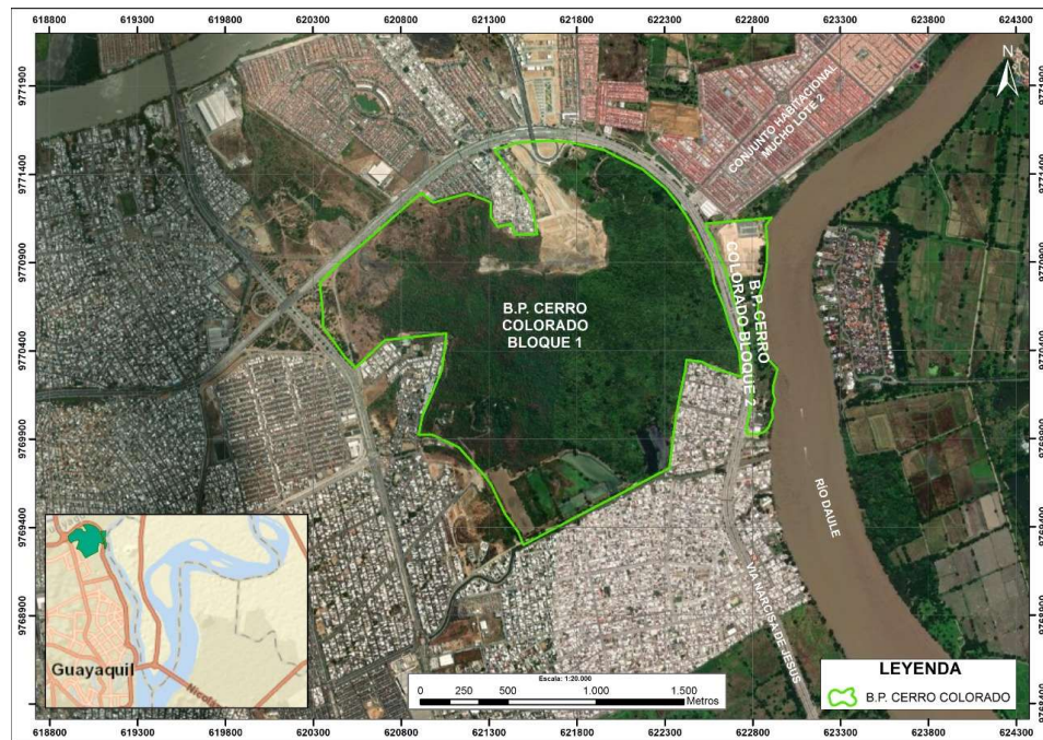
Figura 2: Mapa de ubicación del Bosque Protector Cerro Colorado.

clasificación de Sierra, (1999) y que según el Ministerio del Ambiente actualmente se denominarían bosque deciduo de tierras bajas (Ministerio del Ambiente, 2013a).