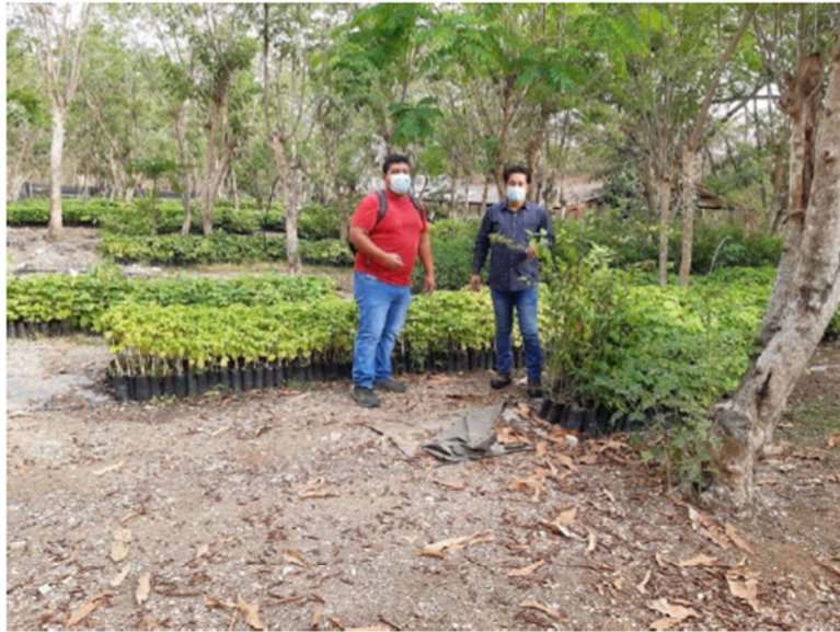
Ilustración 1.- Imagen de entrevista a experto local en vivero forestal en instalaciones de la Fundación ProBosque.