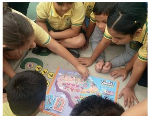
Figura 2.3 Validaciones y pruebas – error del proyecto.