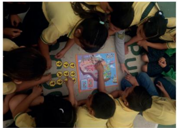
Figura 2.2 Validaciones y pruebas – error del proyecto.