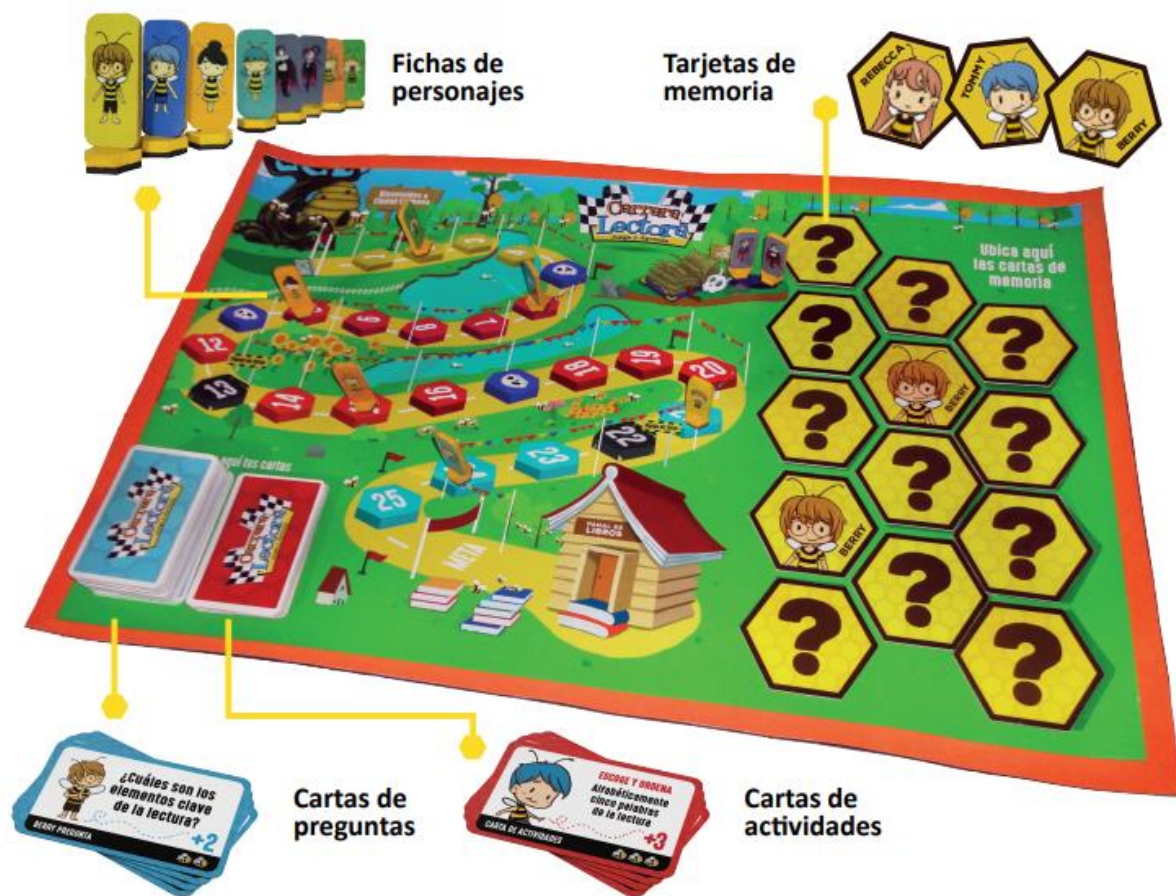
Figura 2.4 Tablero y elementos del material didáctico

Dentro de las entrevistas y validaciones del material didáctico tenemos las siguientes: