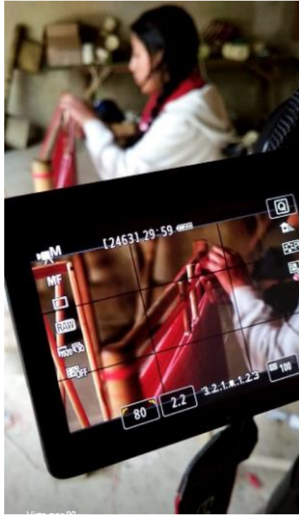
Figura 1. 2 Grabación de una de las etapas para la elaboración de las macanas.