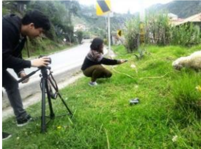
Figura 1. 1 Grabación de escena para documental.

Por otra parte, en fechas determinadas se realizaba la entrega de avances para obtener recomendaciones y hacer las debidas correcciones, para así mejorar la pieza audiovisual.