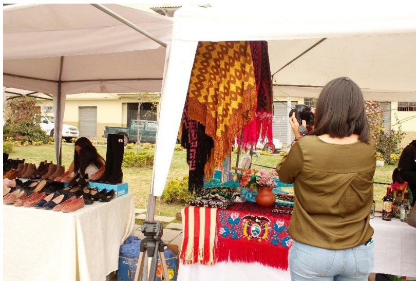
Figura 1. 3 Grabación en feria de artesano del cantón Gualaceo.