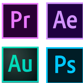
Imagen 2. Software usado durante fase de posproducción

Esta fase se presentó como una de las más duras debido a la exigencia en los detalles.