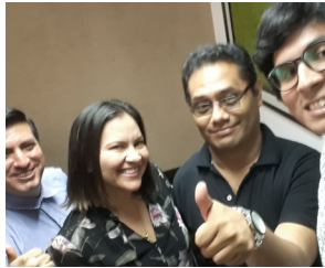
Foto 3. Toma de entrevista a C. Paredes (Guayaquil, 2017)

Durante esta etapa se empezó el rodaje del proyecto. Mediante la obtención de información durante las entrevistas, se fue afinado aún más, la visión de proyecto que se obtenía. Así mismo, al confirmar la cita con cada entrevistado se realizó un perfil del mismo para crear un mejor cuestionario de cara a la realización de la entrevista. De esta forma no solo se ajustaban las preguntas de acuerdo con las capacidades y áreas del conocimiento de cada entrevistado, sino que, además, se iban adecuando los contenidos para que vayan concatenándose a medida que aparecían. Dentro de este apartado se puede resaltar la entrevista realizada a la Doctora Cecilia Paredes, rectora de ESPOL, que dio la estructura fundamental del contenido que se conseguía y que finalmente se convirtió en un hilo conductor del proyecto.