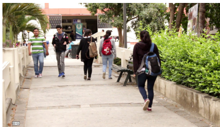
Imagen 3. Toma en Plano General usada