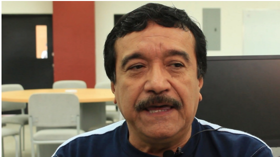
Imagen 5. Toma en Primer Plano utilizada