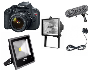
Imagen 1. Equipos utilizados

Cámaras 2 Canon EOS T5 Panasonic HDC-SDT750