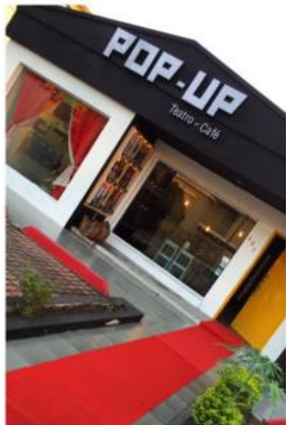
Figura 1.2: POP UP (fachada)

se encuentra cerca al casco comercial y ciudadelas de rango media alta.