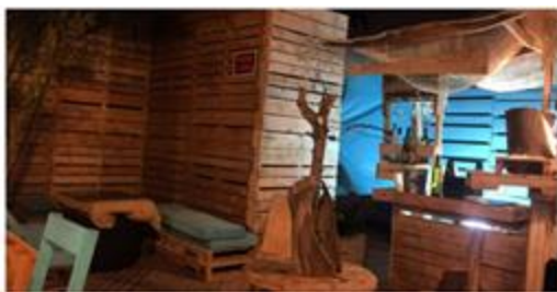
Figura 1.3: POP UP (fachada)

Para la decoración han tomado muy en cuenta el tema del reciclaje ya que gran parte de su mobiliario han sido objetos utilizados para la construcción transformado y llevados a la necesidad de la actividad.