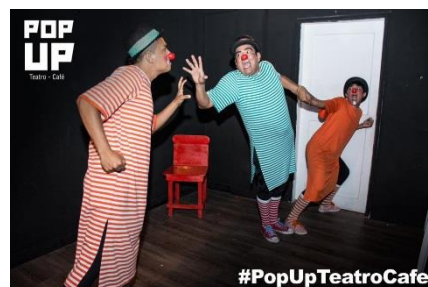
Figura 1.4: POP UP (fachada)

Cada obra posee su equipo de actores, los cuales en ocasiones por actividades varias del actor no cumplen con su presentación colocando a un alterno.