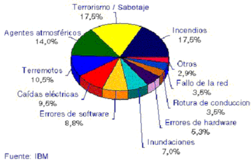
Fig. #2 Gráfico estadístico de riesgos en las redes de cómputo

una evaluación económica del impacto de estos sucesos negativos. Este valor se podrá utilizar para justificar el costo de la protección de la información en análisis, versus el costo de volverla a producir (reproducir).