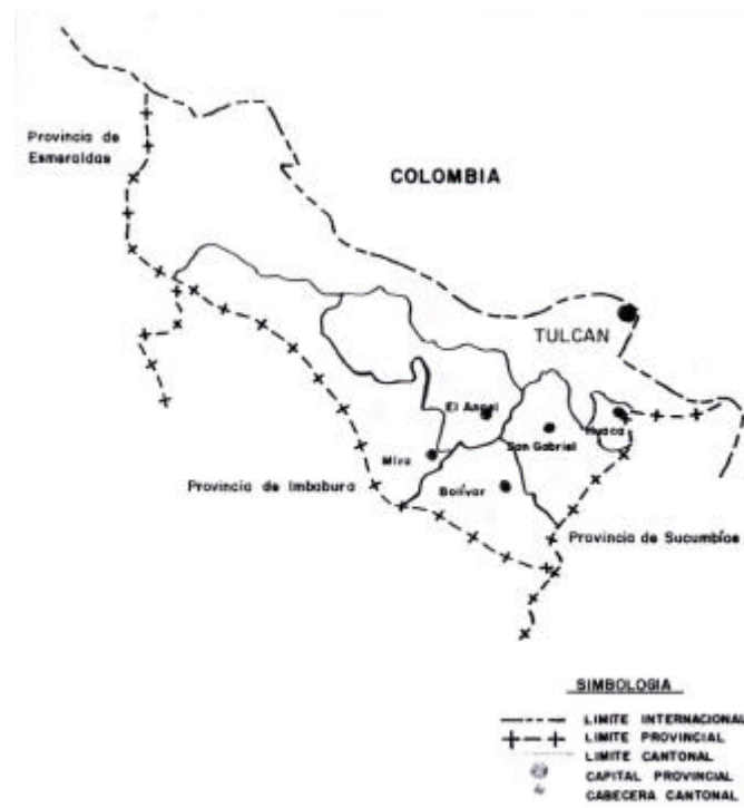
Figura 1.2 Provincia del Carchi: División Política