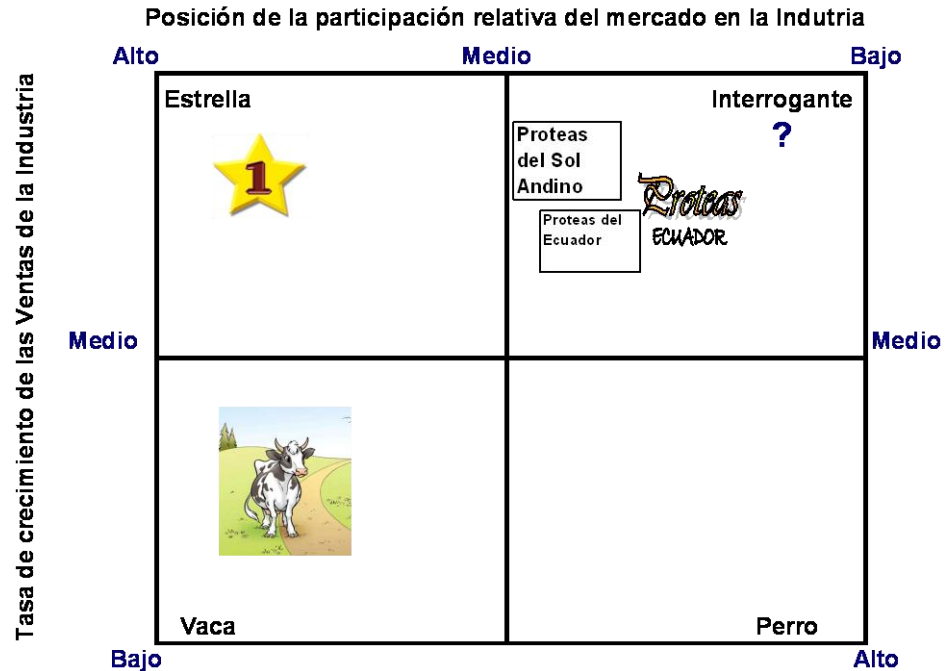
Gráfico No. 4 MATRIZ BCG