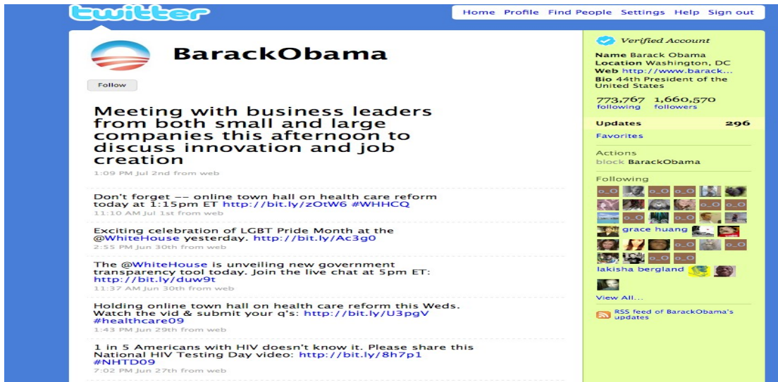
Pantalla de mensajes a Twitter