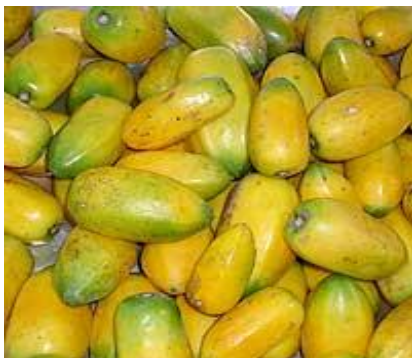
Figura 1.1. Fruto Toronche

Su composición nutritiva incluye proteínas, carbohidratos, vitaminas, calcio, potasio y fósforo considerándose una fruta con altas propiedades nutritivas, al igual que en su composición los frutos inmaduros tienen tal vez el más alto contenido de una enzima proteolítica conocida como enzima papaína muy utilizada actualmente en diferentes industrias a nivel mundial [3].