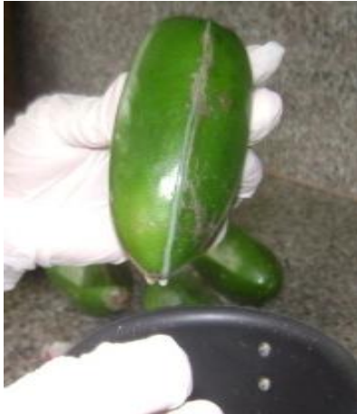
Figura 2.2. Extracción del Látex del Toronche