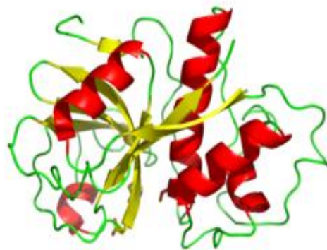
Figura 1.2. Estructura de la Enzima Papaína.

La papaína bruta, contiene un poco de agua, glúcidos, ácidos orgánicos y una mezcla de enzimas, donde destacan las denominadas proteasas que actúan rompiendo los enlaces peptídicos en cualquier lugar de la cadena peptídica en la que se hallen situados (endopeptidasas). También contiene pequeñas cantidades de otras enzimas: papaína peptidasa A, lipasa y lisozima (enzima que rompe las paredes de las células bacterianas) [2].