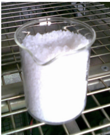
Figura 1. Muestra del antioxidante MB AOX.

Luego de adquirir el material PEAD reciclado, se realizó la limpieza-separación de las impurezas (plásticos más densos que el agua, polvo, basura), colocándolo en tinas con agua para la respectiva selección.