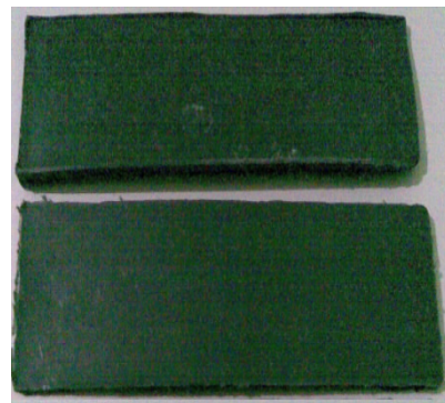
Figura 4. Probetas para ensayo.

Para realizar todos los ensayos propuestos se elaboraron 3 placas de cada mezcla, 30 placas en total para los ensayos y pruebas a realizar.