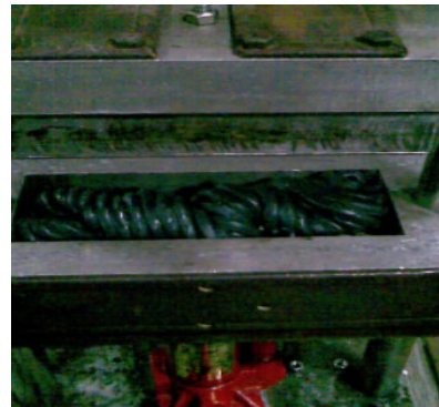
Figura 3. Muestra de PEAD en la prensa.

Al momento de salir el material procesado (fig 2) se debe pesar 39 - 41 gramos e introducir el producto en la cavidad de la prensa, se procede a elevar la sección hembra de la prensa, hasta cuando la gata hidráulica indique una presión de 200 Psi.