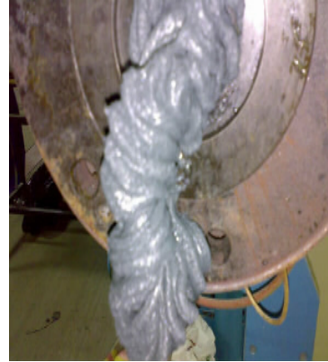
Figura 2. Salida de material de la extrusora.

Al momento de salir el material procesado (fig 2) se debe pesar 39 - 41 gramos e introducir el producto en la cavidad de la prensa, se procede a elevar la sección hembra de la prensa, hasta cuando la gata hidráulica indique una presión de 200 Psi.