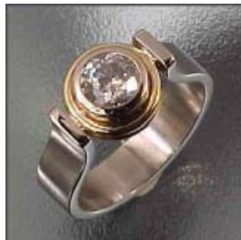
FIG.2 ANILLO DE PLATA

Anillos.- De matrimonio, graduación, diseños exclusivos para mujeres y hombres, anillos solitarios para las mujeres.