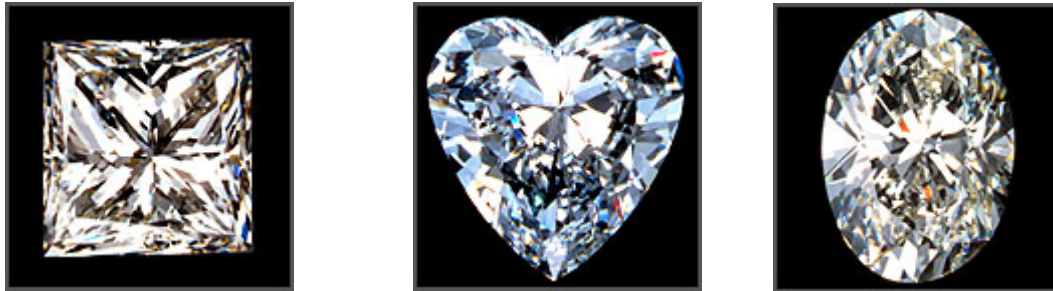
FIG. 1 CORTES DE DIAMANTE

Ecuador importa oro en mayor escala de Estados Unidos y en menor cantidad de Canadá, Inglaterra y México, siendo su precio regulado por el mercado mundial. El destino de estas importaciones puede ser para uso monetario y para otros fines, dentro de los cuales está incluido el oro que se requiere para la elaboración de joyas. El precio del oro y la plata lo fija el mercado de la especulación.