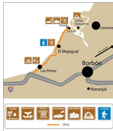
Figura 1. Mapa de la ruta

están a la venta para dejar de fomentar el huaquerismo; recorrer Las Tolas “Montículos artificiales prehispánicos”.