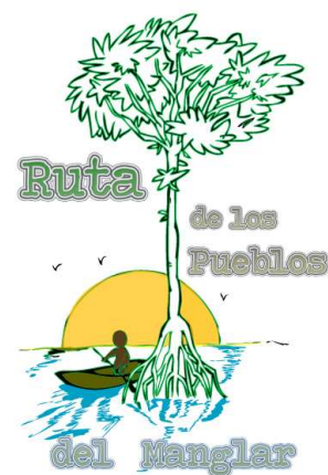
Figura 2. Marca de la ruta

3.4.1. Marca de la ruta. Sigue por objeto el otorgar una imagen identificadora, que será el reflejo externo que captarán los turistas en la Ruta De Los Pueblos del Manglar.