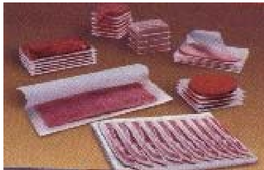
FIGURA 1: Diferentes partes y categorías de carne de res

Este proyecto tiene como finalidad principal entregar al consumidor un producto de buena calidad e higiene, y que a su vez sea satisfactorio, así mismo para poder dar valor agregado y aprovechar la materia prima para la elaboración de productos y subproductos menos perecederos. Los productos que se estarán ofreciendo es la carne de res fileteada en sus diferentes partes y categorías, como por ejemplo: lomo, costilla, cadera, pecho, falda, rabo, etc. Ver figura 1.