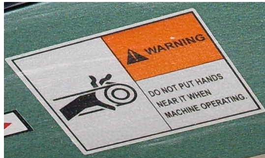
FIGURA 5.2 Peligro Cuidado con las poleas.

En la figura 5.2, se muestra una alerta sobre la caja que cubre las poleas para no poner las manos dentro de ella cuando la máquina está funcionando.