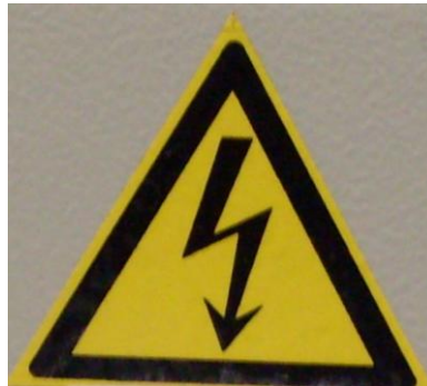
FIGURA 5.1 Peligro de Descarga Eléctrica.

En esta sección se muestra los símbolos de seguridad que se encuentran en la máquina Extrusora Venus, a los cuales se debe prestarle mucha atención; a continuación se mencionará algo sobre ellos y se mostrará la forma que tienen.