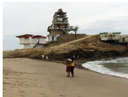
Foto 2. Foto Castillo abandonado