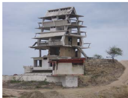
Foto 3. Castillo donde se realizaría el proyecto

Así mismo se ha tratado de aprovechar la ubicación de la estructura abandonada existente, que como mencionamos, alguna vez fue un hotel, en la saliente de mar del sector ya que posee una vista privilegiada. Además cabe mencionar que el diseño de este edificio es muy atractivo y llamativo.