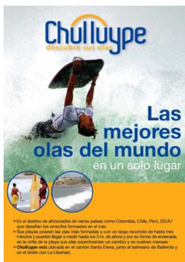
Figura 6. Folletería promocional de Chulluype.

5.3.3. Aspectos Técnicos. El proyecto busca atender principalmente al turismo dirigido a surfistas jóvenes, para lo que se ha planteado áreas para: