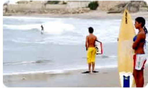
Foto 1. Foto Turistas en Chulluype