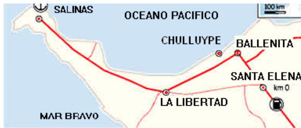
Figura 1. Mapa Ubicación de Chulluype