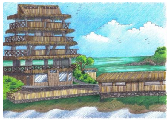
Figura 4. Diseño Perspectiva de la nueva Cabaña Comedor