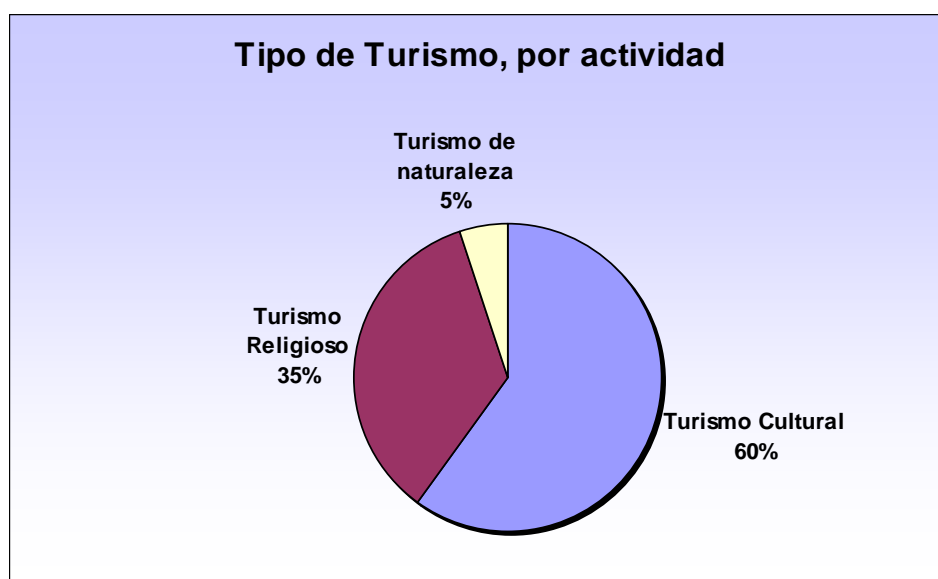
Gráfico 1. Tipo de Turismo

Las preferencias de actividades a realizar en la zona son, el 60% realiza turismo cultural, visitan los museos de antigüedades y mineralógico, el centro histórico de Zaruma y todo lo relacionado con la historia minera de la zona, otro 35% por turismo religioso y peregrinaciones, realizan visitas a los santuarios de la zona, como son la Iglesia Matriz de Zaruma, el santuario del Señor de Roma, la virgen de los remedios, el mirador de San José, y el 5% turismo de naturaleza, visitan ríos, cascadas, lagunas y caminatas a miradores y cerros naturales. (Ver grafico 1)