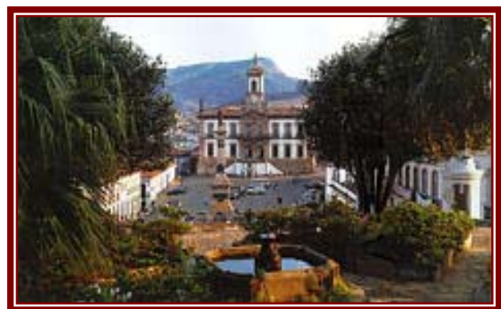
Foto 6. Plaza central de Ouro Preto