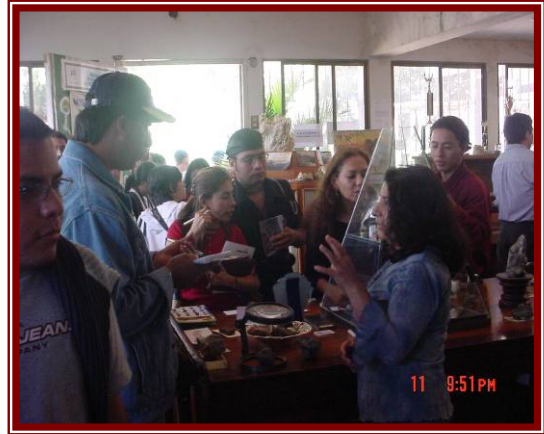
Foto 12. Museo Mineralógico de Magner

Mina del Sexmo El Castillo Minas antiguas de Miranda Instalaciones de la Antigua Planta SADCO Museo Mineralógico de Magner Tuner Museo Mineralógico y de Antigüedades de Tesbita Ordóñez.