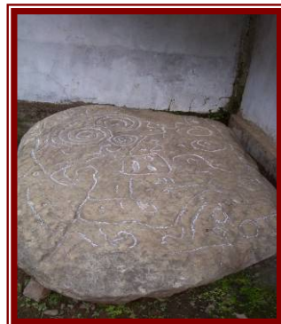
Foto 10. Petrograbado de Salvias, Zaruma

Arqueología del Guayabo Arquitectura de las casas de Zaruma y Portovelo Petrograbados en Salvias, Nudillos, Río Amarillo.