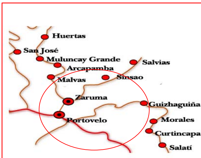
Mapa 1. Ruta del Oro