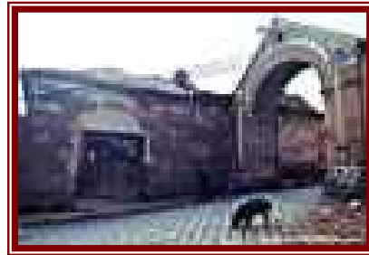
Foto 3 y 4. Vista Panorámica de Potosí