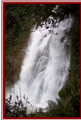
Foto 9. Cascada Chaca Cápac, Zaruma

Cascada de Chaca Cápac Cascada El Molino Laguna Ortega Laguna Chinchilla Cerró de Arcos