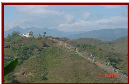
Foto 7. Mirador San José