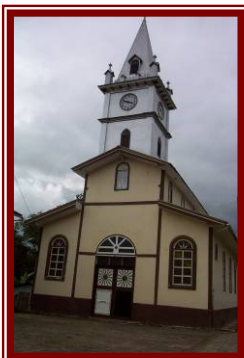
Foto 11. Iglesia de Malvas

Santuario de Señor de Roma Iglesia de Malvas Iglesia Matriz de Zaruma o Santuario de la Virgen de El Carmen