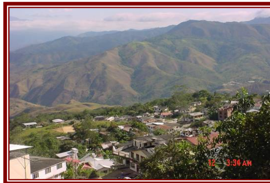
Foto 13. Vista Panorámica de Zaruma

Mirador San José Cerro El Calvario Cerro Zaruma Urcu Colina de La Libertad