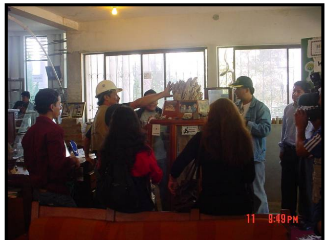
Foto 17. Visita al Museo de Magner Turner