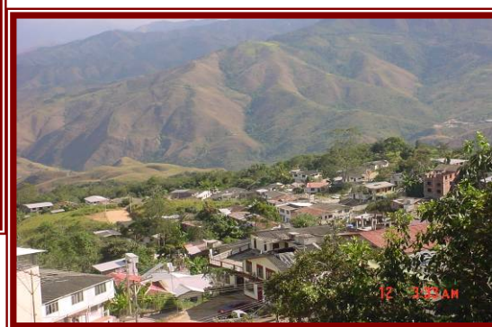
Foto 8. Zaruma, vista panorámica