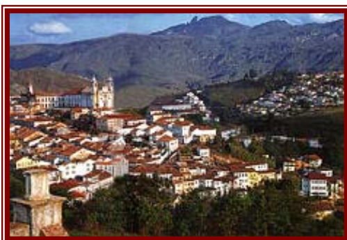
Foto 5. Panorámica de Ouro Preto

Un paseo por las famosas Minas da Passagem, la Cascada das Andorinhas y la Plaza Tiradentes, lo hará remontarse a la época de la colonia brasileña.