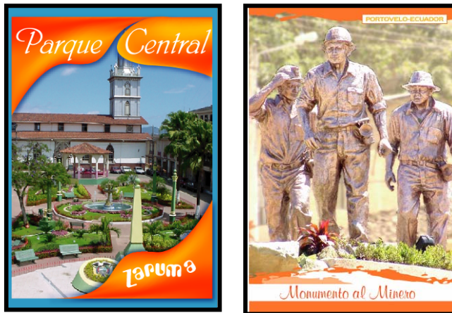
Foto 15. Postales Turísticas de Zaruma y Portovelo

Logrando hacer una base fotográfica de los principales atractivos turísticos de los cantones Zaruma y Portovelo se llevo a cabo el diseño de las postales y póster que ayudaran a la difusión de estos.