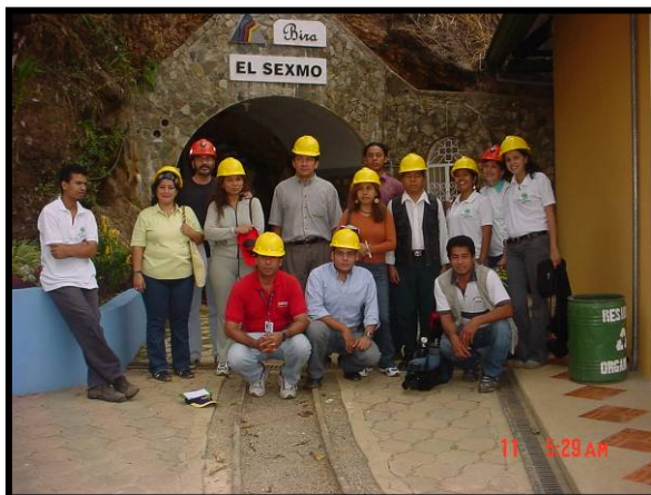
Foto 16. Visita a la Mina de El Sexmo

Sirviendo toda esta información como fuente de respaldo a la candidatura de Zaruma a ciudad “Patrimonio Cultural de la Humanidad”