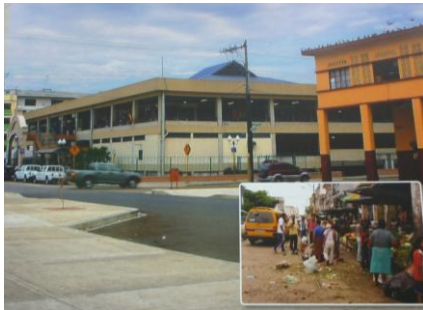
Figura 5. Centro Comercial Artesanal Machala