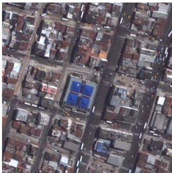
Figura 6. Vista aérea del CCAM

Se pudo constatar que el CCAM atraviesa por dos problemáticas: