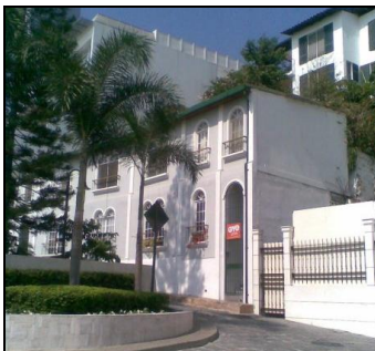
Figura 9. GYE Tienda de Souvenirs