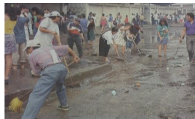
Figura 3. Limpieza externa del mercado de la PPG

...Es entonces que deciden realizar una limpieza exhaustiva del lugar y los alrededores tratando de que el cabildo reconsidere el desalojo previsto para los siguientes días[5].