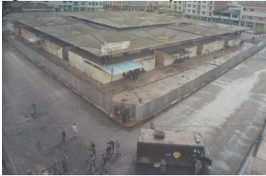
Figura 4. Alrededores del mercado completamente desalojado

En la imagen anterior se puede apreciar a los efectivos policiales y los vehículos especiales utilizados para prevenir cualquier posible desmán durante las primeras horas de la jornada.