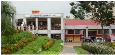
Figura 8. Mercado Artesanal Malecón 2000