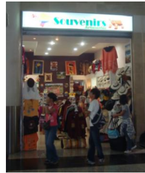
Figura 10. Tienda del aeropuerto J.J. de Olmedo