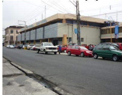
Figura7. Mercado Artesanal Guayaquil