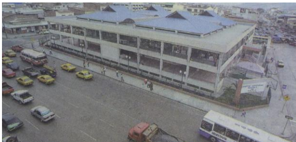
Figura 1. Foto externa del CCAM

El Centro Comercial Artesanal MACHALA (CCAM), antiguamente conocido como Mercado PEDRO PABLO GÓMEZ, está ubicado en la manzana rodeada por las calles Machala, Ayacucho, José de Antepara y Pedro Pablo Gómez de la parroquia Sucre; se levanta sobre un área de construcción de 13.400 m 2 , tiene 556 puestos de artesanías distribuidos en dos plantas, 12 de ellos expenden comidas preparadas, cuenta con 86 espacios de parqueo en el semisótano. Existen dos accesos: una escalinata ubicada en la acera norte de la manzana y una rampa en la acera sur. Posee también pequeñas áreas verdes, áreas de carga y descarga de recolección de desechos, oficina administrativa, baterías sanitarias para discapacitados y garita central automatizada.