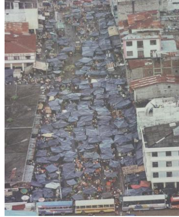
Figura 2. Exteriores del mercado de la PPG

impacto de este sector frente a la ciudad. Por este motivo, se emprende el proyecto y se decide trasladar a los 1.235 comerciantes informales que laboraban en el mercado ubicado en la calle Pedro Pablo Gómez a la explanada del mercado Gómez Rendón (Abel Castillo y Maldonado) para de esa manera, poder renovar y regenerar dicho sector.