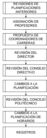
Figura 2. Estructuración de un Sistema Informático Gerencial.

Se describe en la siguiente figura el flujo operativo de la planificación académica de la ESPOL.