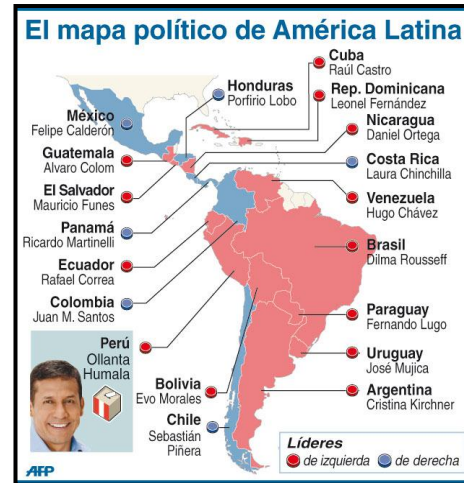
Gráfico II: Mapa Político en América Latina

infografía, lo cual nos permite visualizar como se encuentra dividida políticamente Latinoamérica en base a una clasificación de dos ideologías: Derecha e Izquierda que ha sido utilizada para crear nuestra variable dummy en el modelo.