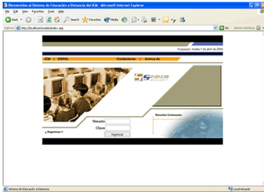
Figura 4.3. Pantalla de Ingreso.

Para iniciar, planteamos el diseño de la pagina de ingreso del Sitio (Figura 4.3), la cual se presenta, en el área de mayor visibilidad. También se presentan las áreas reservadas para el logotipo del Sitio, logotipos de indicaciones de registro y de recordar contraseña, enlaces, etc.