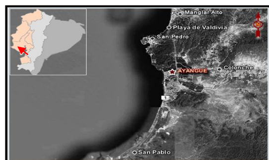
Mapa No.2. Playa de Ayangue, Santa Elena Ecuador

2.1.2 Mapa. En el siguiente mapa se muestra la ubicación del Balneario de Ayangue con los límites a las poblaciones más cercanas (Mapa No. 2).