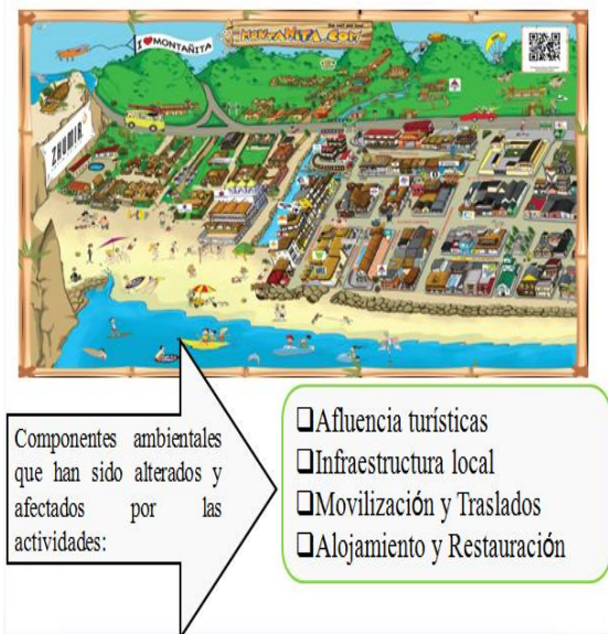
Figura 6: Componentes ambientales afectados

Fuente: Datos de la investigación Elaborado por: Tesistas