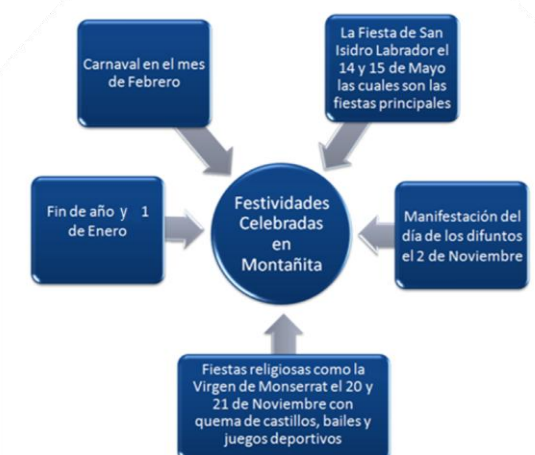
Figura 2: Festividades Celebradas en Montañita

2.1.5 Entorno Cultural. En la Comuna Montañita se celebran las siguientes festividades: